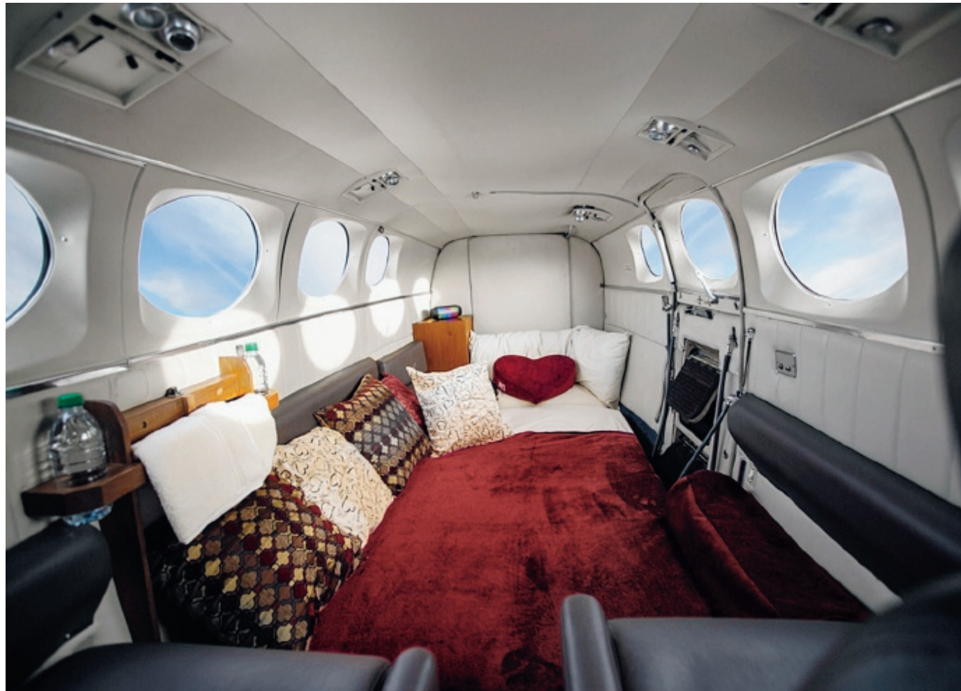
VIAGGI A LUCI ROSSE Sopra e in alto, gli interni del jet della compagnia Love cloud. Allo studio un aereo più grande per voli erotici di gruppo

Per questo l'imprenditore ha deciso di creare una società che organizza voli ad alta quota nella zona di Las Vegas, dentro un jet privato trasformato in una specie di alcova. La compagnia si chiama Love cloud, perché il valore aggiunto del viaggio non è il panorama ma appunto l'amore tra le nuvole. Il listino prevede due formule principali. C'è il volo diurno su un itinerario che sorvola il Red Rock Canyon, Hoover Dam, il lago Meade e poi Las Vegas e quello not-